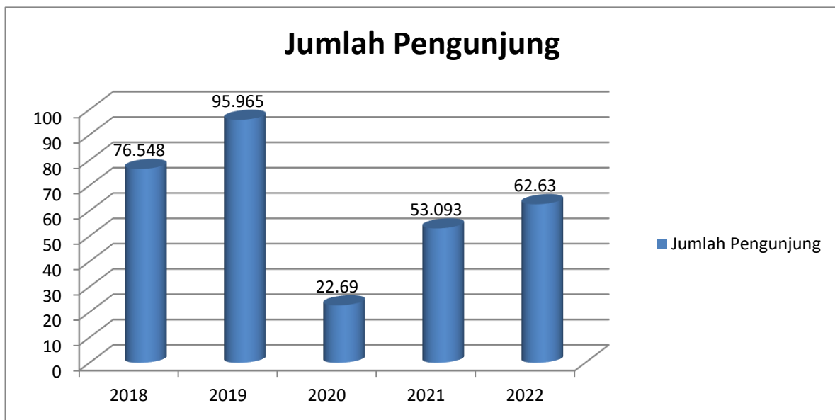
Figure 1. Grafik Pengunjung Perpustakaan Daerah Magelang

Setelah menganalisis menggunakan excel dapat diketahui bahwa jumlah pengunjung Perpustakaan Daerah Magelang pada tahun 2020 menurun pesat, dan pada tahun 2021-2022 jumlah pengunjung Perpustakaan Daerah Magelang naik kembali seperti pada grafik dibawah ini.